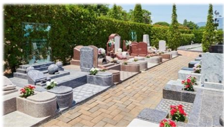
ご家族&ペットの埋葬数に 制限のないゆったりタイプ

同じ区画の中でご家族と愛するペットと一緒に眠れるお墓が今、とても人気です。エンゼルパーク上田でも区画が完売しましたので、来春（2025.3～）増設販売が決定いたしました。